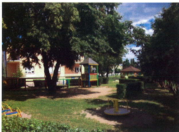
Fot.8 Plac zabaw i przedszkole na azymucie 131°

Wydział Telekomunikacji i Teleinformatyki Politechniki Wrocławskiej, 50-370 Wrocław, Wyb. Wyspiańskiego 27, fax: +48 (71) 3223473, tel. +48 (71) 3203087, 3202497