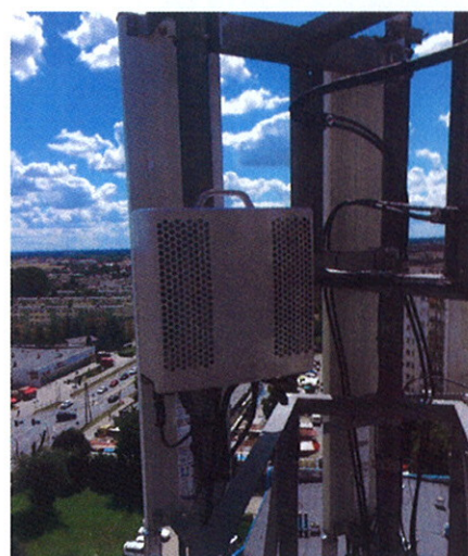
Fot.5 Anteny sektorowa na azymucie 177°