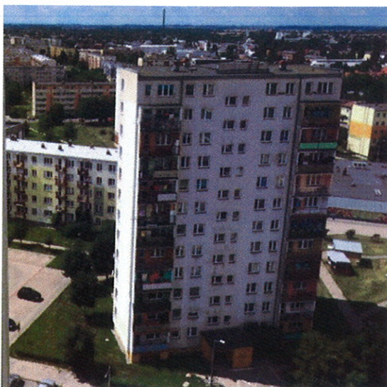
Fot.2 Widok na antenę sektorową na azymucie 285/295°

Wydział Telekomunikacji i Teleinformatyki Politechniki Wrocławskiej, 50-370 Wrocław, Wyb. Wyspiańskiego 27, fax: +48 (71) 3223473, tel. +48 (71) 3203087, 3202497