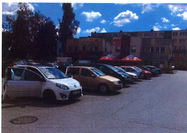
Fot.6 Parking przed supersamem i blok mieszkalny ul. Jana Pawła II nr 43