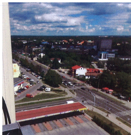
Fot.3 Widok na antenę sektorową na azymucie 55°