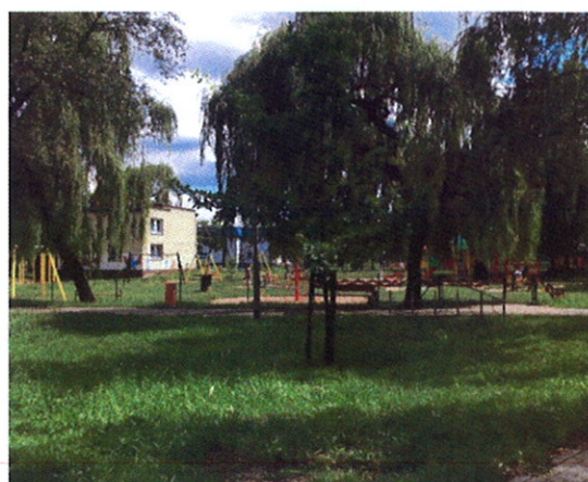
Fot.7 Park i plac zabaw na azymucie 175/177°