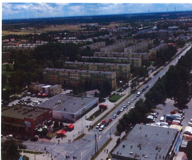
Fot.4 Widok na antenę sektorową na azymucie 175/177°