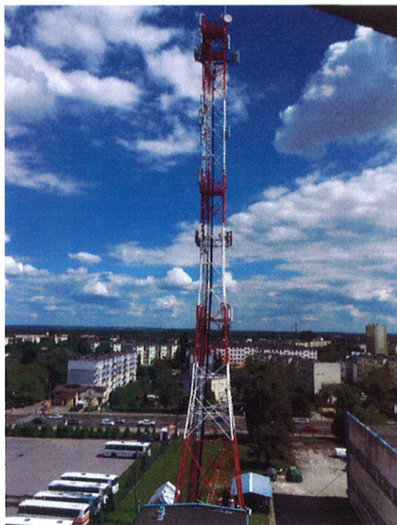
Fot.1. Stacja bazowa na wieży kratownicowej w Sieradzu