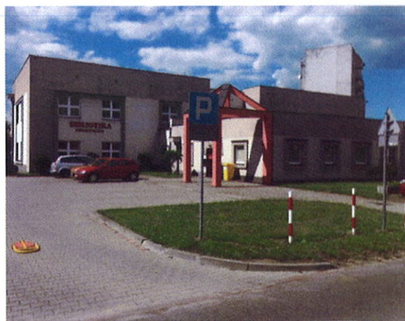
Fot.8 Biblioteka miejska na azymucie 285/295/300°