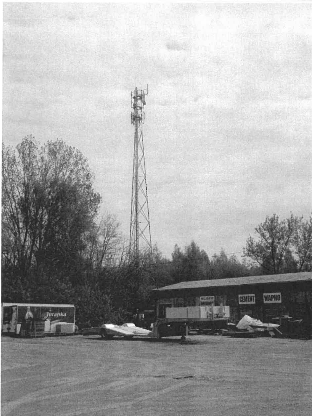
Załącznik nr 3 Instalacja Radiokomunikacyjna Orange Polska S.A. 3233 (89971NI) D14 TUMIDAJ (WSR_BRZEZNO_BRZEZNO) Dokumentacja fotograficzna

Sprawozdanie z badań bez pisemnej zgody laboratorium nie może być powielane inaczej niż w całości. Wynik przedstawione w niniejszym sprawozdaniu odnoszą się wyłącznie do badanego obiektu i do warunków i konfiguracji urządzeń w dniu wykonywania pomiarów.