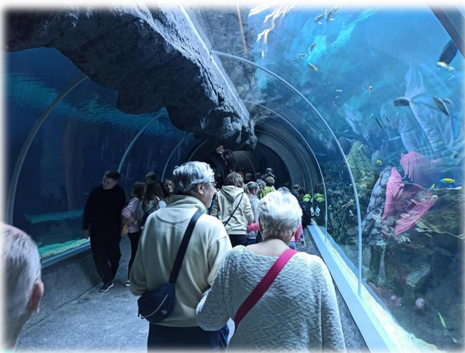
Foto: Wycieczka do Orientarium ZOO w Łodzi.

km od Sieradza, przy trasie Sieradz- Woźniki-Poddębice. Dom mieści się w dwóch budynkach, w których znajdują się pokoje dwu, trzy i czteroosobowe z odpowiednio wyposażonymi łazienkami i WC. Głównym budynkiem jest zabytkowy pałac z końca XIX wieku. Pałac otoczony jest malowniczym parkiem z resztkami starodrzewia. Obydwa budynki posiadają nowoczesną infrastrukturę i są w pełni dostosowane do potrzeb osób niepełnosprawnych ( instalacje , winda, odpowiedniej szerokości drzwi, brak progów, natryski, poręcze, uchwyty itp.) Od 1 lipca 2021 r. w oddzielnym budynku funkcjonuje także oddział dla osób przewlekle psychicznie chorych. Budynek ten jest przeznaczony dla 36 osób i w całości, również ta część którą wcześniej zajmował Środowiskowy Dom Samopomocy, został zaadaptowany na potrzeby mieszkańców z tym schorzeniem. W celu aktywizacji mieszkańców odbyły się 32 imprezy w Sieradzu i 16 w Rożdżałach w tym 7 zabaw tanecznych. Dom Pomocy Społecznej wziął udział między innymi w Wystawie tradycyjnych stołów wielkanocnych", "Pikniku Służb Mundurowych" oraz "Jarmarku Adwentowym". Na terenie placówki odbył się piknik integracyjny Polsko – Ukraiński.