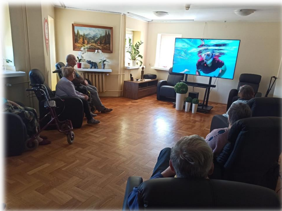
Foto: Uruchomienie sali kinowej dzięki środkom finansowym fundacji Orlen.

Przestronny ogród zimowy na parterze budynku głównego łączy się oddzielnym wejściem (z podjazdem dla wózków inwalidzkim) z ogrodem letnim. Są w nim tereny spacerowe, miejsce na grill, oraz część dla amatorów czynnego wypoczynku.