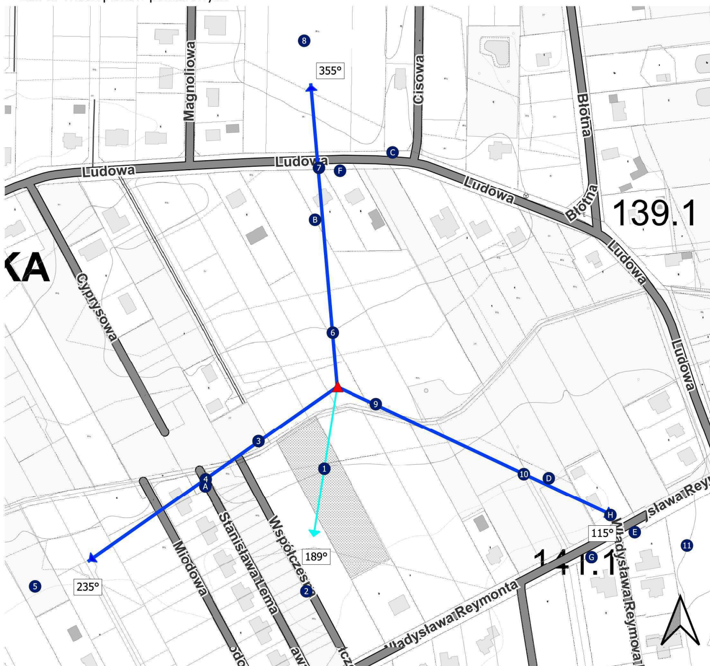
Zał. 2. Widok pionów pomiarowych